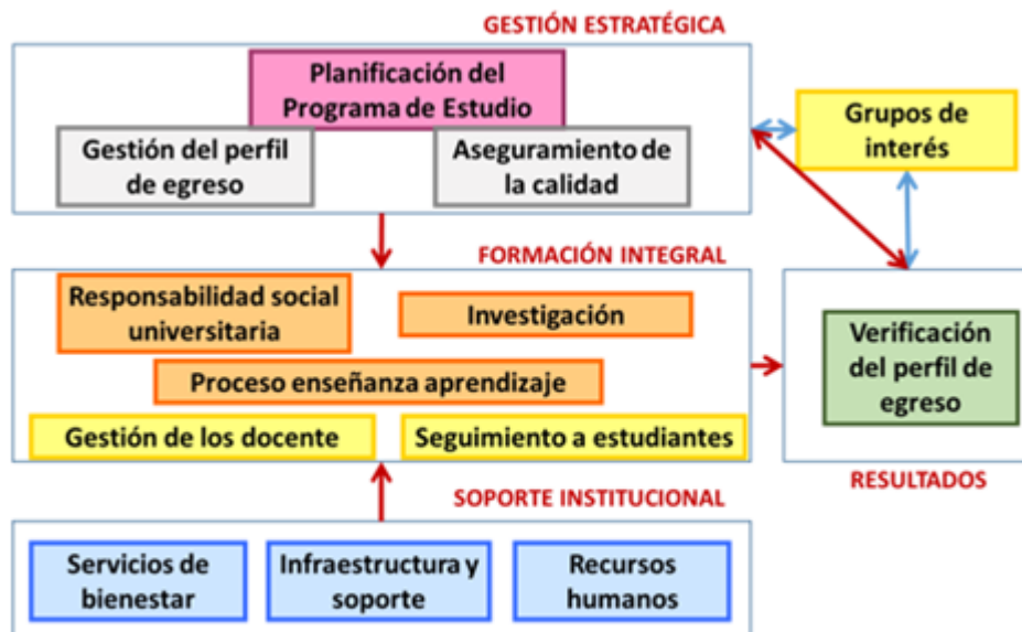
Relación de dimensiones y factores del modelo de acreditación de programas de estudios universitarios